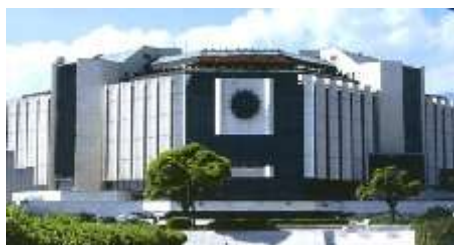
Palais National de la Culture (NDK)