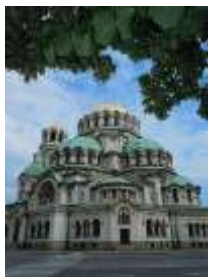
Cathédrale Alexander Nevski