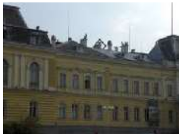
Ancien Palais Royal