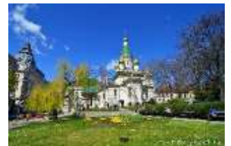
Eglise Russe St Nicolas